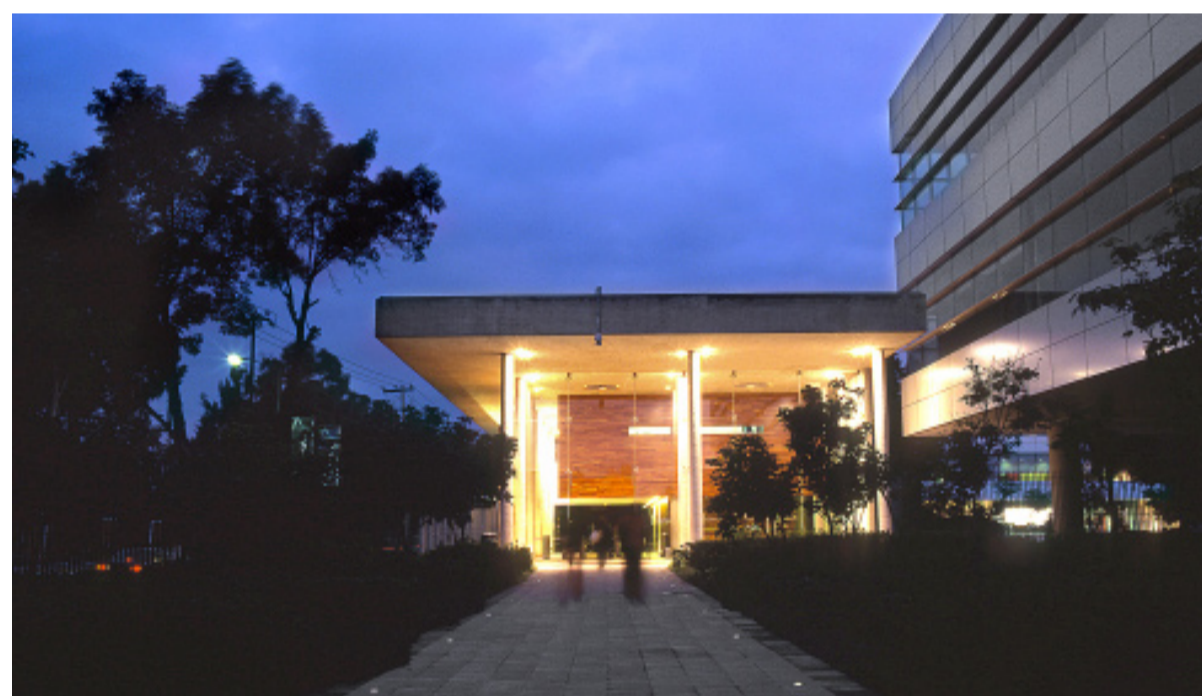
El desarrollo fue diseñado bajo rigurosos estándares internacionales.