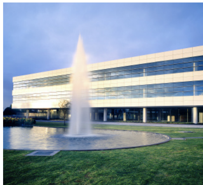
El plan maestro contempla grandes espacios de áreas verdes.