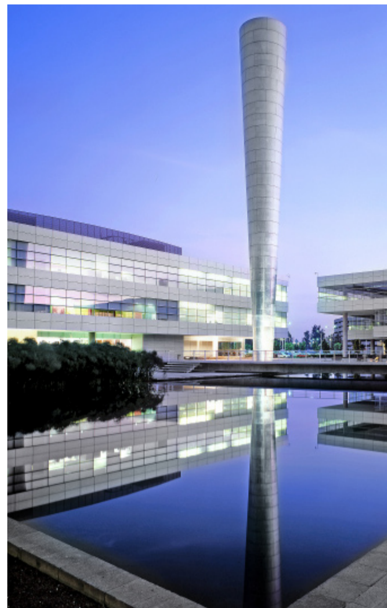
TecnoParque ofrece alta eficiencia y bajo costo de mantenimiento.

GALARDONADO CON EL PREMIO OBRAS CEMEX 2006