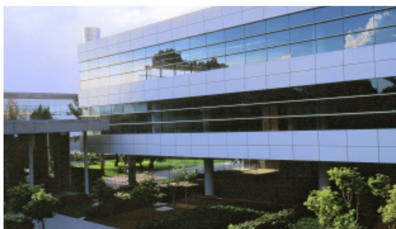
El proyecto está pensado para empresas que buscan mejorar la calidad de vida de sus empleados.