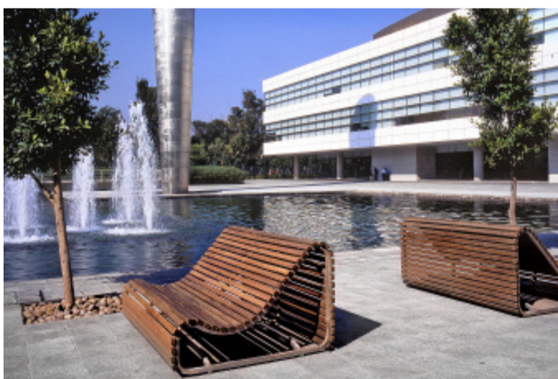
Las zonas de descanso y recreación permiten a los usuarios ser más productivos.

T ecnoParque, afirman sus creadores, es el primer parque tecnológico y de negocios de la Ciudad de México. Se trata de una alternativa para ubicar a empresas privadas e instituciones nacionales o multinacionales que buscan espacios modernos y eficientes, que además reduzcan sus gastos de ocupación y operación.