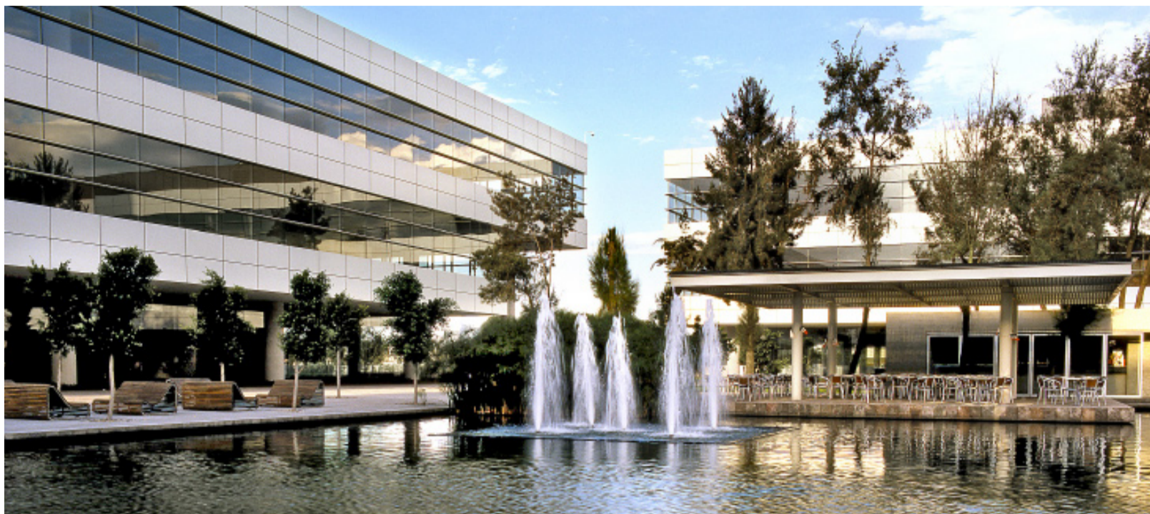
El diseño de TecnoParque le ha merecido diversos reconocimientos.